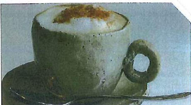
キャラメル・マキアート

また、「キャラメル・マキアート」¥220「シナモン・ラテ」¥200が新たにルーチェメ あら ニューに加わりましたので、光の丘へお立ち寄りの際はご来店をお待ちしております。 くわ ひかり おか たよ さい らいてん ま